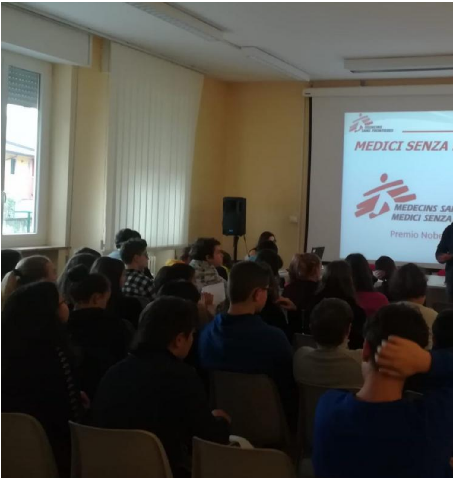
Partecipazione al corso di formazione per medici e infermieri svizzeri a Basilea. Medici senza frontiere è un'organizzazione internazionale.